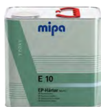
Mipa EP-Härter E 10 kurz EP-tužidlo „krátke“

Mipa EP-Härter E 10 kurz Epoxy hardener fast