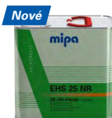
Mipa 2K-HS-Härter EHS 25 NR 2K-Akrylové tužidlo „normál“ pre Mipa 2K-HS-Klarlack.

6 x 0,5 l | 23720 0000 6 x 1 l | 23721 0000S 4 x 2,5 l | 23723 0000