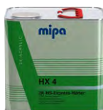
Mipa 2K-HS-Express-Härter HX 4 2K-Akrylové tužidlo pre Mipa 2K-HS-Express-Klarlack CX 4

6 x 1 l | 23751 0000 4 x 5 l | 23755 0000