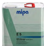
Mipa EP-Härter E 5 extra kurz EP-tužidlo „extra krátke“

6 x 0,5 l | 23680 0000 4 x 2,5 l | 23682 0000