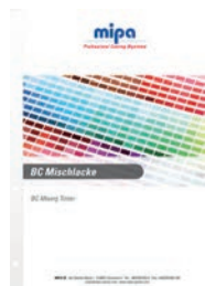
Mipa Karta kolorów BC (składany plakat)